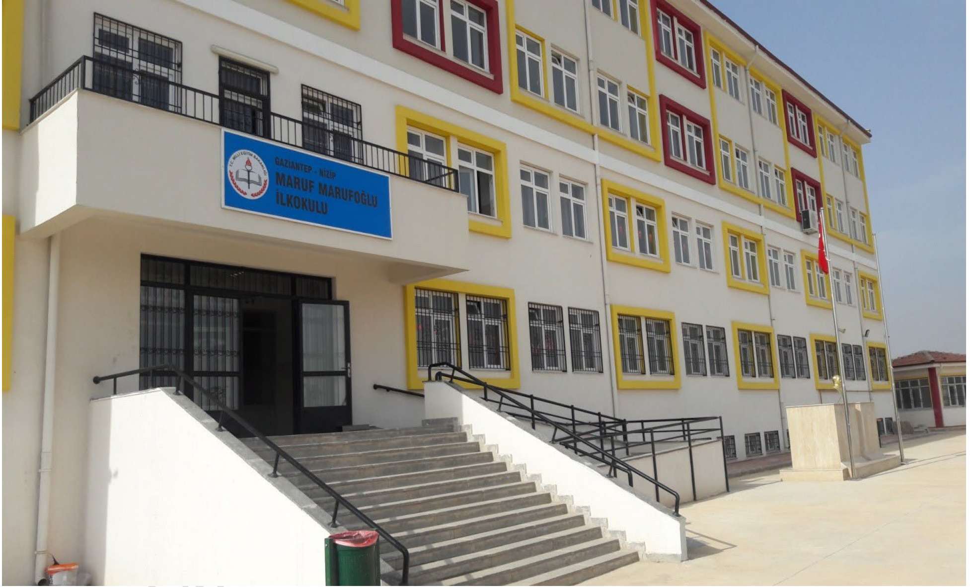
MARUF MARUFOĐLU İLKOKULU